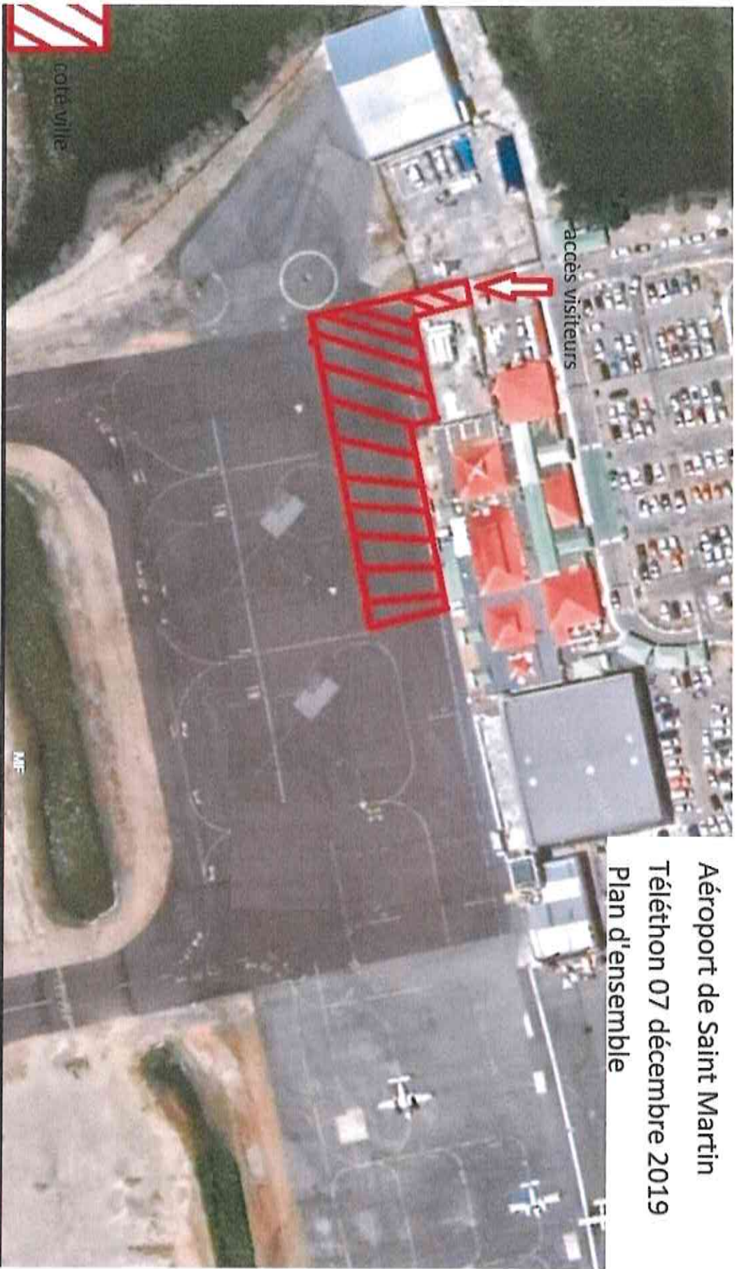
Aéroport de Saint Martin Téléthon 07 décembre 2019 Plan d'ensemble